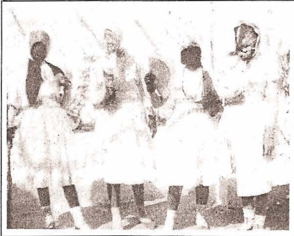
Las macunits en la década de los cuarentas.

Señor Teofilo desde el más allá seguro que también estará presente en estas celebraciones.