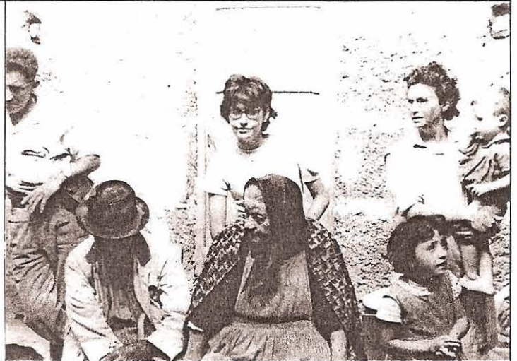
Su última foto